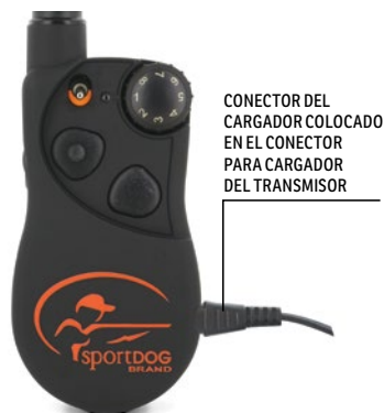
CONECTOR DEL CARGADOR COLOCADO EN EL CONECTOR PARA CARGADOR DEL TRANSMISOR

NOTA: La batería tiene una duración aproximada de 140 a 160 horas, en función del uso.