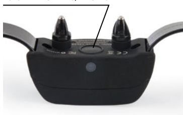
BOTÓN DE ENCENDIDO/APAGADO

NOTA: La batería tiene una duración aproximada de 140 a 160 horas, en función del uso.