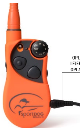
OPLADERSTIK SAT I FJERNSENDERENS OPLADERJACKSTIK