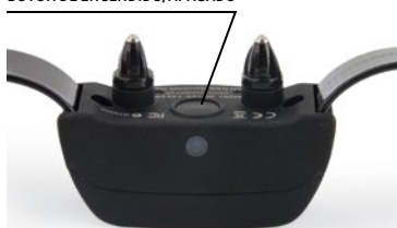
BOTÓN DE ENCENDIDO/APAGADO

NOTA: La batería tiene una duración aproximada de 140 a 160 horas, en función del uso.